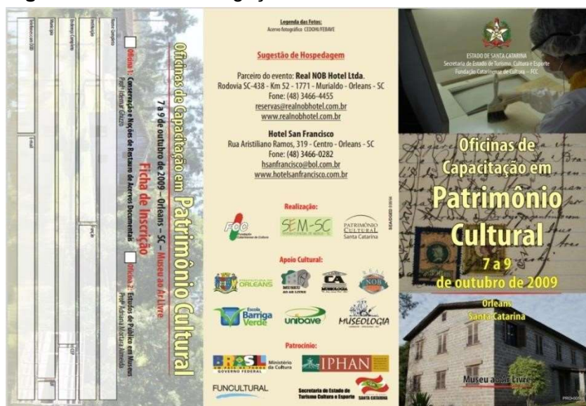
Figura 1: Folder de divulgação de oficinas