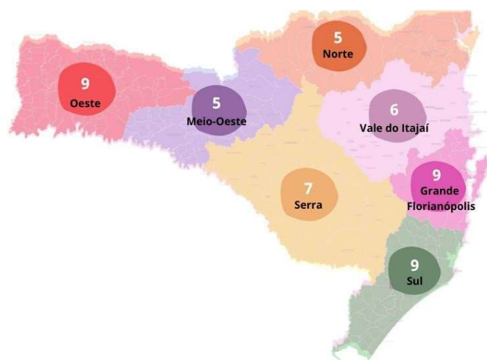
Figura 2: Quantidade total de oficinas por região museológica